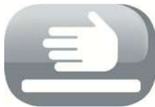
Tapa de seguridad

Tapa portapilas: Esta estufa está equipada con tapa de protección para pilas.