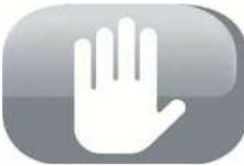
Botón de apagado

Botón de apagado: La estufa está equipada con un botón de apagado instantáneo en caso de emergencia.