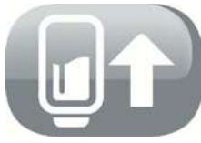
Depósito de combustible extraíble

No requiere instalación: Esta estufa puede utilizarse sin necesidad de cables ni sistemas de evacuación, lo que la convierte en una fuente de calor muy cómoda de utilizar.