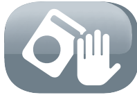
Automatic tip-over switch

No requiere instalación: Esta estufa puede utilizarse sin necesidad de cables ni sistemas de evacuación, lo que la convierte en una fuente de calor muy cómoda de utilizar.