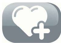
Automatic extension mode