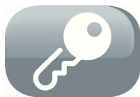
Child proof lock