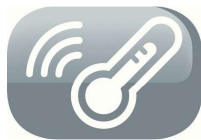
Room temperature thermistor